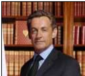
Monsieur Nicolas Sarkozy